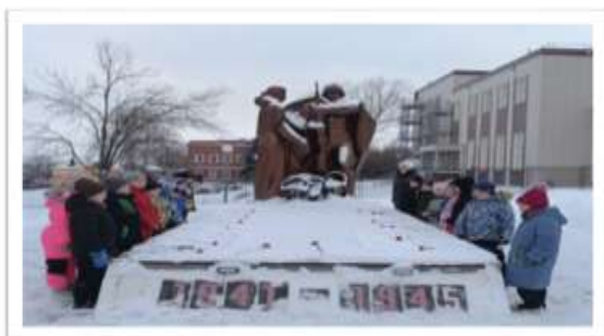
Митинг, посвященный «Дню неизвестного солдата»