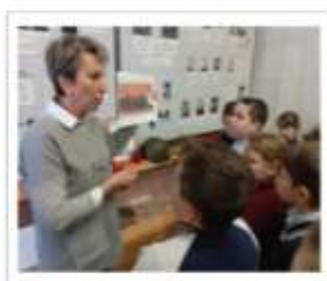
2 «в» класс