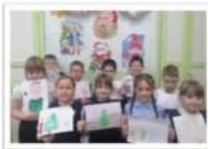
Акция «Письмо солдату» поздравление с Новым годом