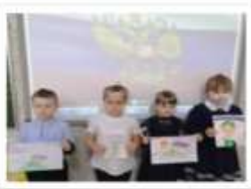
2 «в» класс