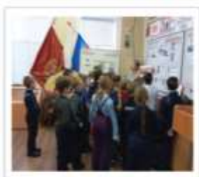
Мероприятие в краеведческом музее «День неизвестного солдата»