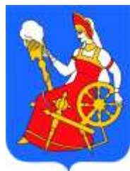
Рис. 2. Герб города Иваново

На все иллюстрации в тексте должны быть даны ссылки.